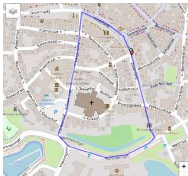
Hanzeloop in Zutphen

In Lochem houden we op zaterdag 25 mei van 12.00 tot 14.00 uur een flyeractie. En kort voor de verkiezingen, op zaterdag 1 en zondag 2 juni, gaan we in Doetinchem en Zutphen Volt op de kaart zetten in de Achterhoek. Zowel voor de Hanzeloop in Zutphen als de actie in Doetinchem hebben zich al mensen opgegeven. We willen natuurlijk met zoveel mogelijk Volters aanwezig zijn dus geef je op via de website. Als je plekken ontdekt waar nog geen 'Durf je'-stickers te zien zijn, laat het dan ook weten.