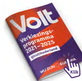
Volt Verkiezingsprogramma 2021-2025