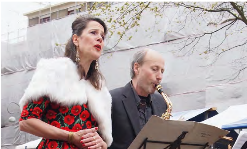
© | Marianna Selleger & Dirk Hooglandt

Muziek die Marianne graag zingt is door haar zelf bewerkt voor saxofoon en stem. Dat levert een wonderlijk magische versmelting van klanken op, want sax en stem kleuren prachtig bij elkaar. Klassieke aria's, volksmuziek, klezmer, Italiaanse filmmuziek en een enkele smartlap behoren tot het repertoire.