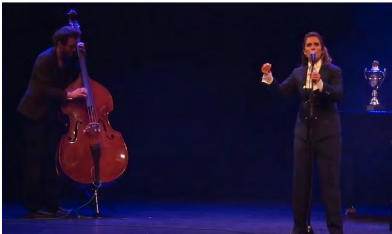
© | Rosa da Silva | Photo by Jaap Reedijk

Tekst: Rosa da Silva | Muzikant: Remko Wind | Muziek: Daniël Lohues, Rosa da Silva, Sergio Escoda en Remko Wind | Regie: Titus Tiel Groenestege