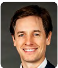
Laurens Dassen Fractievoorzitter Volt Nederland