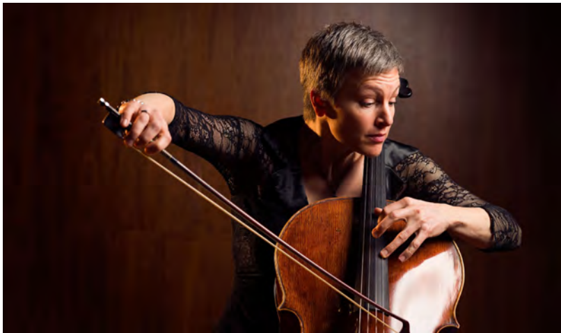
Quirine Viersen

“Het bestuderen en spelen van muziek vanuit het emotionele niveau is essentieel voor me. Naast de waarde van analyse en kennis volgt mijn musiceren zijn krachtigste weg als het vanuit het hart komt. Ik wil cello spelen om die puurheid en essentie van de muziek over te brengen. Het voelt ook als de juiste manier om de luisteraar mee te nemen in de grote beweging, om samen ‘ontketend’ te raken.”