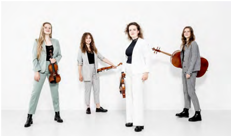
© | ADAM Quartet | photo by Foppe Schut

Met een frisse blik zoekt het ADAM Quartet naar manieren om haar eigen licht te laten schijnen op het strijkkwartet en daarbij trouw te blijven aan de essentie van het genre. Het jonge kwartet trad na hun conservatoriumopleiding op tijdens de Strijkkwartet Biënnale Amsterdam en het Grachtenfestival en in grote zalen zoals de Nationale Opera en het Muziekgebouw aan 't IJ. In 2020 ontvingen ze het Stipendium voor strijkkwartetten van Het Kersjes Fonds. In het seizoen '21-'22 treedt het ADAM Quartet o.a. op in TivoliVredenburg Utrecht, de Stadsgehoorzaal Leiden en de MIRY Concertzaal te Gent.