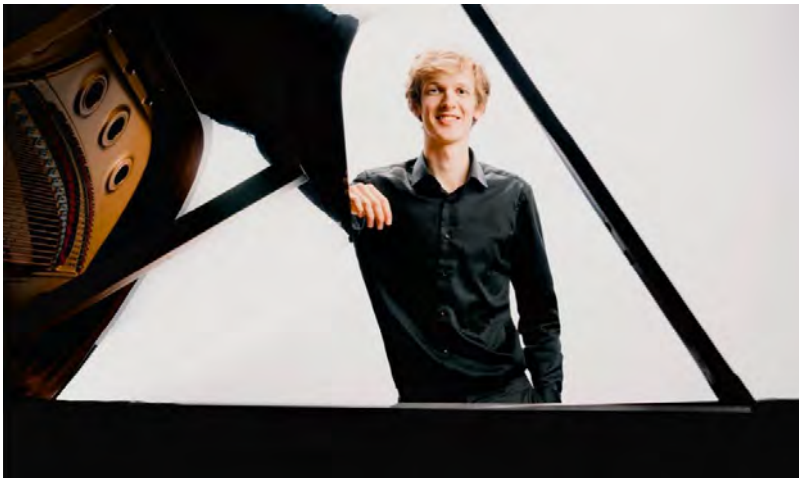
© | Rik Kuppen| photo by Foppe Schut

In het eerste jaar van zijn conservatoriumstudie won hij de eerste prijs in de landelijke finale van het Prinses Christina Concours. Gedurende zijn opleiding raakte Rik geïnteresseerd in het lied-repertoire en speelde hij veel samen met zangers. Tijdens de finale van het Internationaal Vocalisten Concours te 's-Hertogenbosch in 2015 werd hij hiervoor beloond met de prijs voor jong getalenteerde lied-pianist.